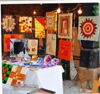
ARTISTES & EXPOSANTS

Dimanche à partir de 21h30 : le groupe Tricky Train et le Docteur Boost vous feront vivre 2 concerts de rock accompagnés d' Aquatique Show , feux d'artifice et lasers !