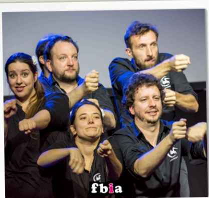
THÉÂTRE AVEC LA LOLITA

Spectacle "Festival de Feux" - Acte III : FOOT LEGEND ! orchestré par l'artificier Alex Battinger (France). Un grand spectacle dédié à l'histoire du football en musique et en images avec Aquatique Show : 100 ans de la LAFA