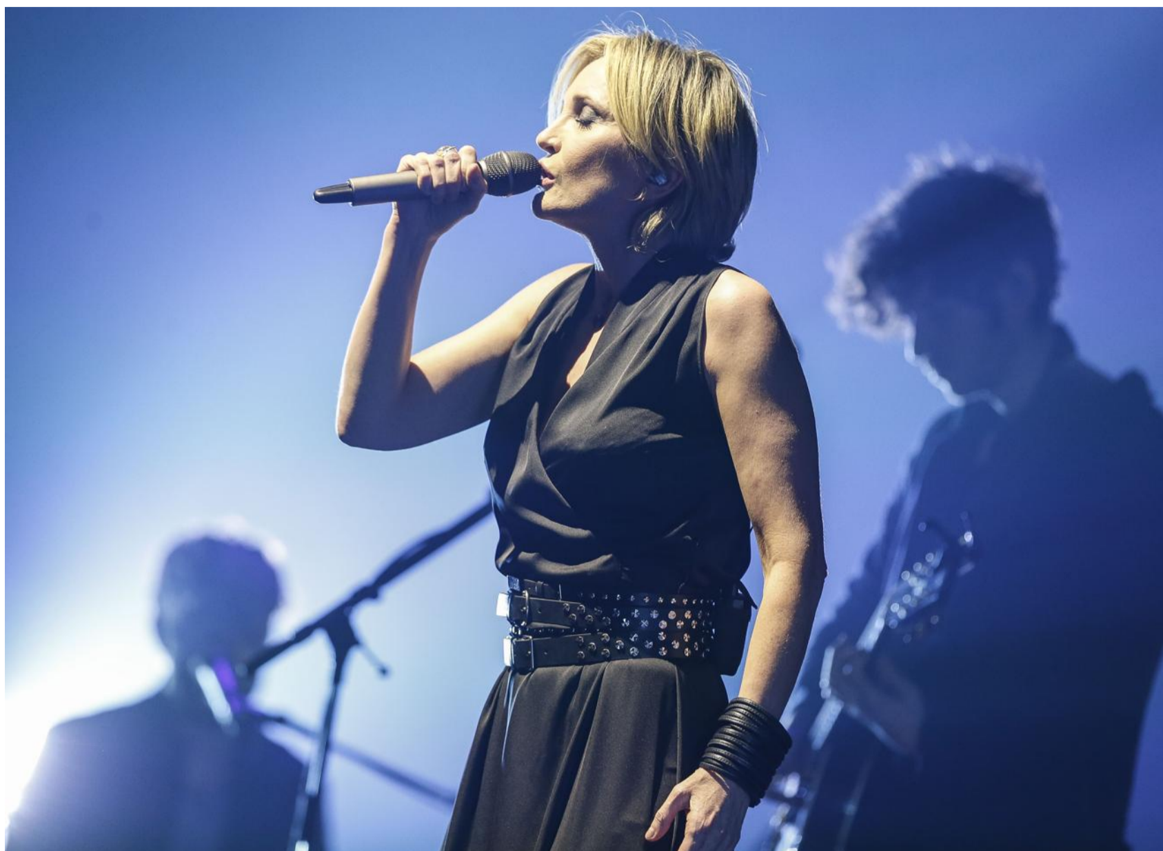
Patricia Kaas sera en concert à Furdenheim.

► Découvrez des milliers d'idées de fêtes et de sorties au fil des 104 pages de notre supplément Estivales, qui précise le calendrier des manifestations prévues en Alsace jusqu'en septembre. À consulter sur www.dna.fr (rubrique Suppléments)